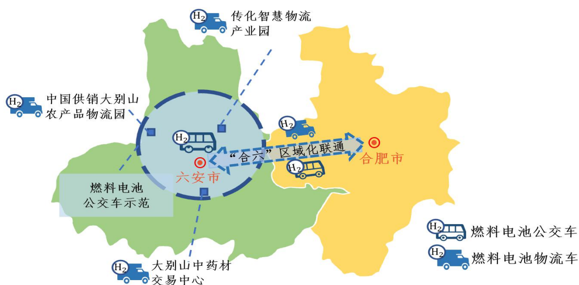
图 2 燃料电池汽车示范应用图

制定燃料电池公交车示范运营方案，扩大燃料电池汽车示范运营范围，支持鼓励在新增及更新公交车、环卫车、市政工程车时采购燃料电池汽车。积极推动在合六城际客运等线路上进行燃料电池汽车替代示范。依托全市物流园区建设，把握长三角一体化、合六同城化发展、合六经济走廊建设契机，推动市内、城际间以及区域内燃料电池物流车的示范运营。创新运营模式，积累示范经验，为燃料电池物流车规模化推广提供可行的商业化运营模式。到 2025 年，全市范围内累计推广燃料电池公交车、市政用车、城际客车等 100 辆左右，推广燃料电池物流车 500 辆左右。到 2030 年，随着燃料电池关键核心技术高度自主化，成本显著下降，燃料电池汽车推广规模化效应显现，全市范围内累计推广公交车、市政用车以及城际客车等 1000 辆左右，推广燃料电池物流车 2000 辆左右。