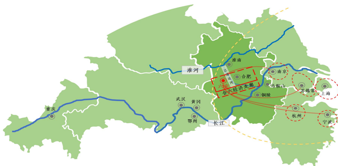
图 3 区域市场格局

3. 以长江和淮河生态保护为契机，扩大船用燃料电池市场空间。抓住船用能源清洁替代机遇，发挥我市大功率燃料电池研发制造的优势，加强与马鞍山、芜湖、铜陵、淮南、蚌埠等沿江河城市合作，推动我省内河船舶更新改造，扩大船用燃料电池市场空间，提升我市船舶用大功率燃料电池动力系统研发制造能力。通过燃料电池船舶通行航道的联通建设，带动港口加氢网络和氢能供应体系建设，构建以绿色船舶为主要应用场景的氢能产业生态。密切与长江中上游都市圈氢能发展合作交流，进一步拓展船用燃料电池应用市场空间。